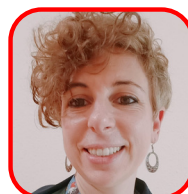
VILLA VALENTINA Fisioterapista Riab. Neuromotoria